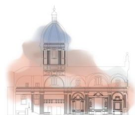
Chiesa del Voto