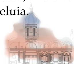
Chiesa del Voto

Regina dei cieli, rallegrati, alleluia. Cristo, che hai portato nel grembo, alleluia, è risorto, come aveva promesso, alleluia. Prega il Signore per noi, alleluia.