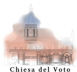
Chiesa del Voto

Sotto la tua protezione cerchiamo rifugio, santa Madre di Dio: non disprezzare le suppliche di noi che siamo nella prova, ma liberaci da ogni pericolo, o Vergine gloriosa e benedetta.