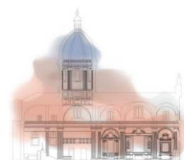
Chiesa del Voto

Il Signore è il mio pastore: nulla manca ad ogni attesa; in verdissimi prati mi pasce, mi disseta a placide acque. Il Signore è il mio pastore: dietro lui mi sento sicuro. Pur se andassi per valle oscura, non temerò alcun male perché tu mi sei vicino e mi sostieni. Quale mensa per me tu prepari, sotto gli occhi dei miei nemici! E di olio mi ungi il capo: colmo è il mio calice di ebbrezza! Bontà e grazia mi sono compagne, quanto dura il mio cammino: io starò nella casa di Dio lungo tutto il migrare dei giorni.